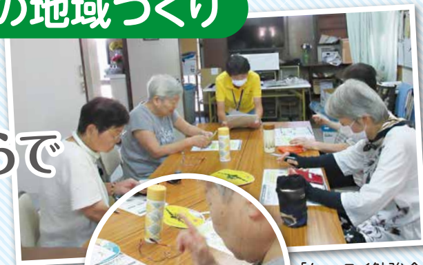
「ケータイ勉強会」の様子

百歳体操で、生活支援コーディネーターが参加者に配付した広報誌に、此花区社会福祉協議会の公式LINEのQRコードが掲載されていました。