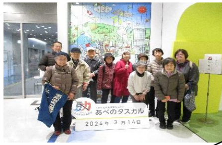
3/14(木) 「あべのタスカル」 参加者 女性7名 男性2名 「震度7」体験時間は長く感じました。