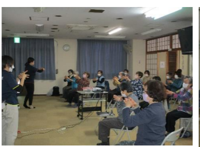
3/29(金) 「音楽健康体操」 参加者 女性32名 男性2名 音楽に合わせて楽しい<脳トレ>でした