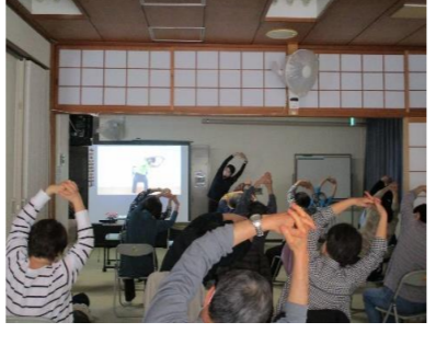
3/29(金) 「音楽健康体操」 参加者 女性32名 男性2名 音楽に合わせて楽しい<脳トレ>でした