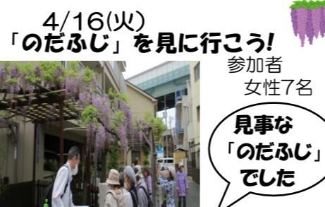
4/16(火) 「のだふじ」を見に行こう! 参加者 女性7名 見事な「のだふじ」でした