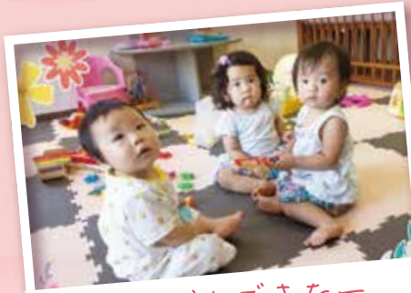
お友だちできたー