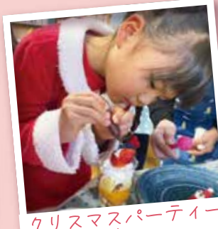
クリスマスパーティーでケーキ作り