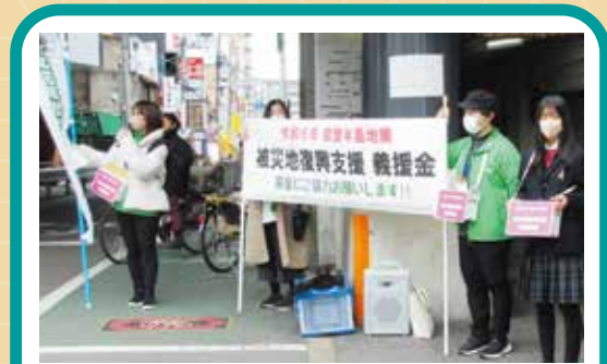
2月16日には昇陽高校生徒会の生徒と一緒に街頭募金を実施しました。 (集まった義援金は「能登半島地震災害義援金」として日本赤十字社に送金)