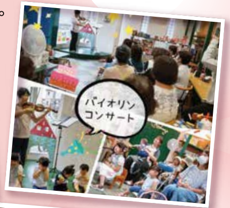
バイオリンコンサート