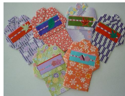
着物のぼち袋（手紙入れ）

レク部では紙を使った遊びや手作りをしています。「レク部と一緒に楽しみたい。」という施設や地域の皆様、ご連絡ください。内容は相談に応じます。