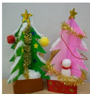
クリスマスツリー