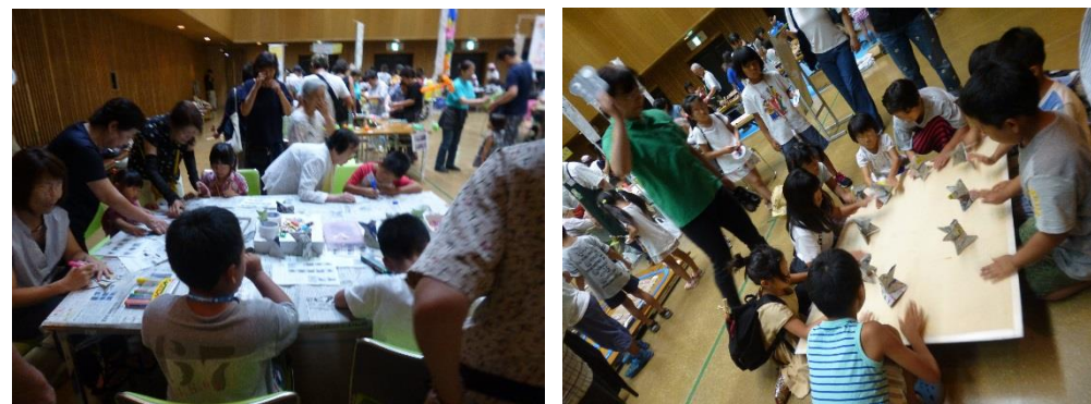
このはなすこうランド（7月28日（土）の様子

このはなすこうランドでは、子どもたちと紙すもうで対戦しました。「昨年が楽しかったので、今年も子どもが楽しみにしていたんです。」とお母さんが言われました。ボランティアさんたちも「今日は楽しかった」と満足されていました。