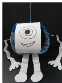
牛乳パック ヨーヨー

このはなすこうランドでは、子どもたちと紙すもうで対戦しました。「昨年が楽しかったので、今年も子どもが楽しみにしていたんです。」とお母さんが言われました。ボランティアさんたちも「今日は楽しかった」と満足されていました。