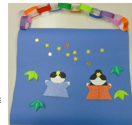
6月で作った「七夕飾り」です